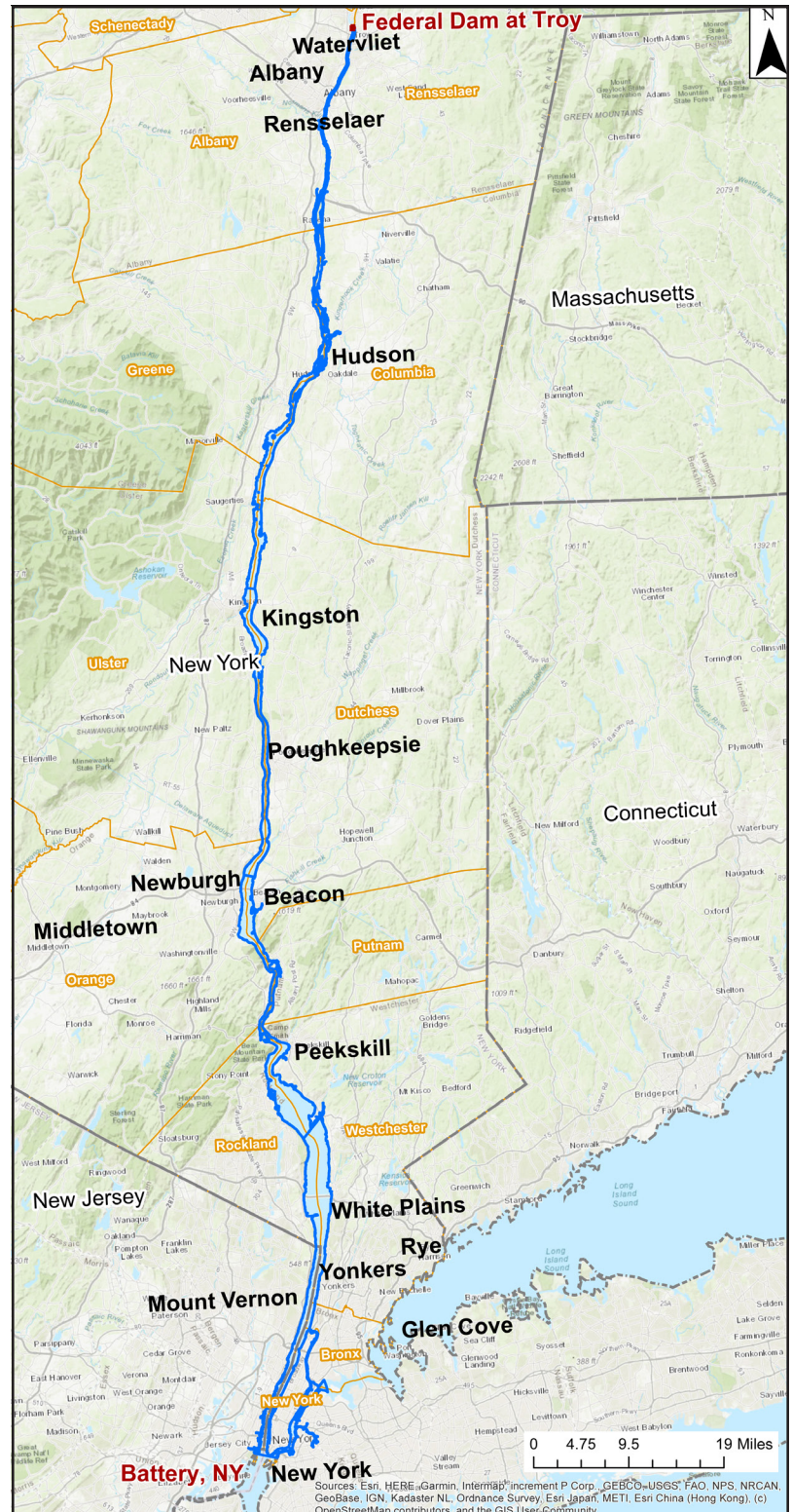
Mapa general de la cuenca inferior del río Hudson

Para obtener más información e inscribirse, visite la página web del Sitio Superfund Hudson River PCBs de la EPA .