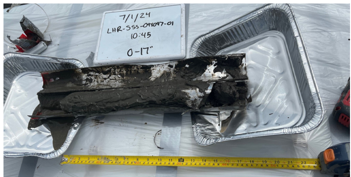
(Arriba y abajo) Muestreo de sedimentos