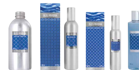
600 ML | 200 ML | 100 ML | 250 ML

Bergamote, cyprès, poivre, bois de cèdre, ambre blanc, feuilles de violette, oud, cuir, tonka, musc, vétiver et patchouli.