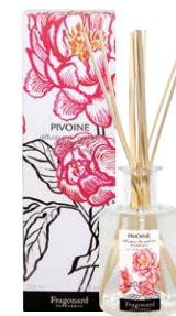
PIVOINE RÉF. N3213

Diffuseurs livrés avec 10 bâtonnets d'osier. Ne pas faire brûler les bâtonnets. Dangereux. Respecter les précautions d'emploi.