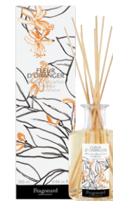
FLEUR D'ORANGER RÉF. N3204