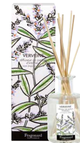
VERVEINE RÉF. N3214