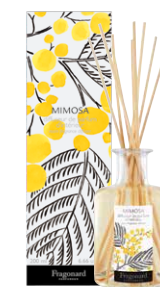
MIMOSA RÉF. N3201