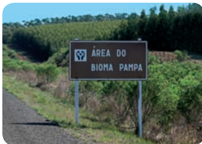
Eucaliptos no Pampa

Outra ameaça relevante é a introdução de espécies com potencial invasor, tais como javalis ( Sus scrofa ), bagres-africanos ( Clarias gariepinus ), rãs-touro ( Lithobates catesbeianus ) e tigres-d'água ( Trachemys scripta e Trachemys dorbignii ), cuja dimensão do impacto sobre as populações de répteis e anfíbios nativas é ainda pouco conhecida, entretanto, sabe-se que estes animais atuam como predadores, competidores e também como vetores de diversas doenças à fauna silvestre nativa.