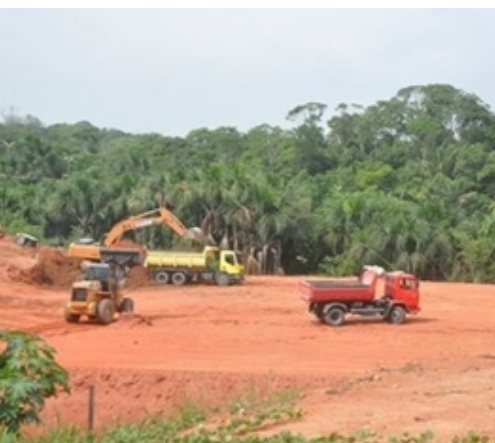
“Área verde do Tatumã, em Manaus, vem sendo cada vez mais reduzida para dar lugar a condomínios”

O desmatamento, descaracterização e fragmentação dos habitats da Amazônia continuam sendo as principais ameaças à espécie.