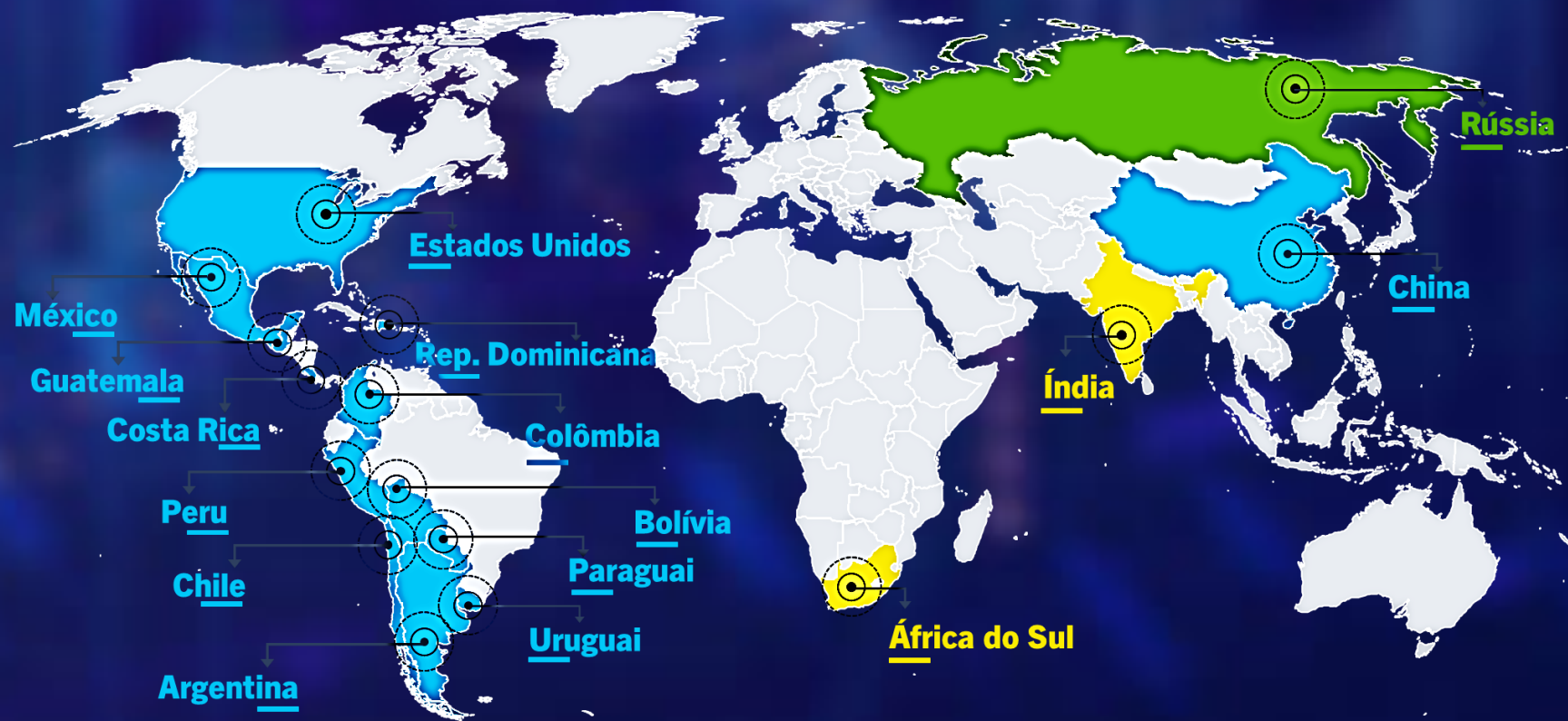
% Declarações de Exportação