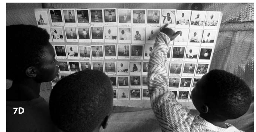
1D Dans le local de l'Agence centrale de recherches du CICR, camp du site B, Thaïlande, 1988. 2D Discussion à la délégation du CICR, Bagdad, Irak, 1991. 3D Réunie avec sa fille, une mère serre dans ses bras la femme qui s'est occupée de l'enfant portée disparue, frontière Rwanda-Zaïre, 1994. 4D Formulaires de demande de recherches, cartes d'enregistrement et messages Croix-Rouge, conflit israélo-arabe, 1973. 5D Transfert de détenus, Sud-Liban, 1998. 6D Femme écoutant un message Croix-Rouge lu à voix haute, Bosnie-Herzégovine, 1994. 7D Programme CICR de regroupement familial, Rwanda, 1997.