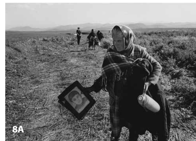
1A Assistenza ai profughi ruandesi, Goma, Zaire, 1996. 2A Segnale che indica campi minati, Nicaragua, 1998. 3A Arrivo dei profughi a Nong Chan, Tailandia, 1980. 4A Cimitero danneggiato, Beirut, Libano, 1982. 5A Un veicolo danneggiato del CICR, Bosnia-Erzegovina, 1992. 6A Una casa devastata dall'esercito, Gerusalemme Est, 1997. 7A Una moschea distrutta nel conflitto, Sud Libano, 2006. 8A Rifugiato a Hadrut, Armenia/Azerbaigian, 1991. 9A Un soldato Karenni di 13 anni si prepara per un'imminente offensiva, Myanmar, 1999. 10A Una visita in prigione da parte del CICR, Monrovia, Liberia, 2006.