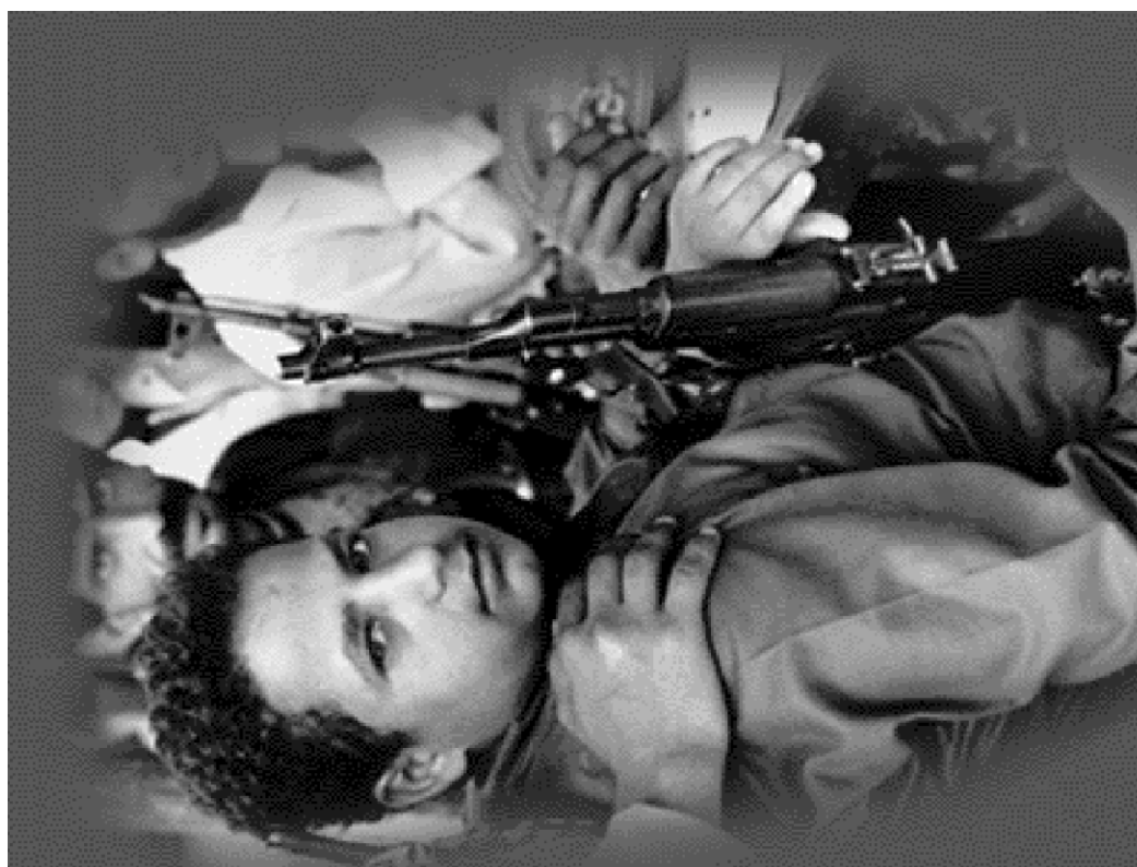
Istraživanje 10: Deca vojnici