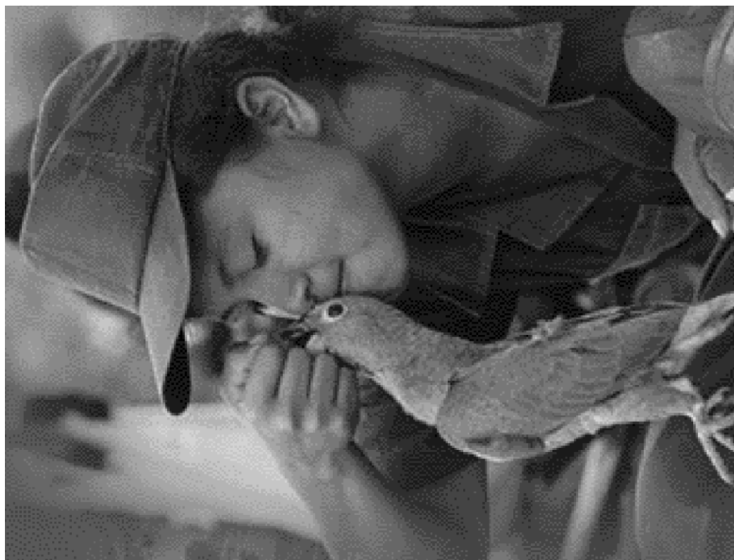
Istraživanje 10: Deca vojnici