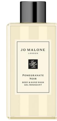
غسول الجسم واليدين

Lime Basil & Mandarin Pomegranate Noir English Pear & Freesia Red Roses