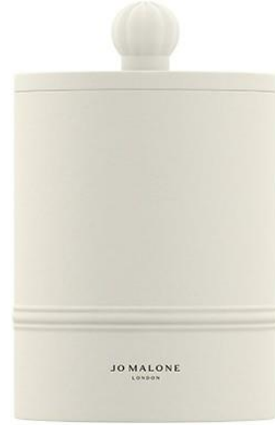
Glowing Embers Candle SAR 595