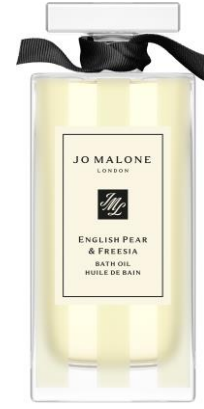
زيت الاستحمام والاسترخاء

اكتشفوا منتجات الكولونيا، والشموع، وكريمات الجسم بالحجم الصغير، وما إلى ذلك من المنتجات الصغيرة التي تناسب المغامرات الكبيرة.