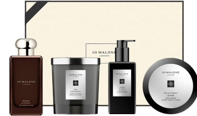
Myrrh & Tonka Cologne 100ml, Oud & Bergamot Home Candle 200g, Myrrh & Tonka Shower Oil 250ml, Velvet Rose & Oud Body Crème 175ml SAR 2,090