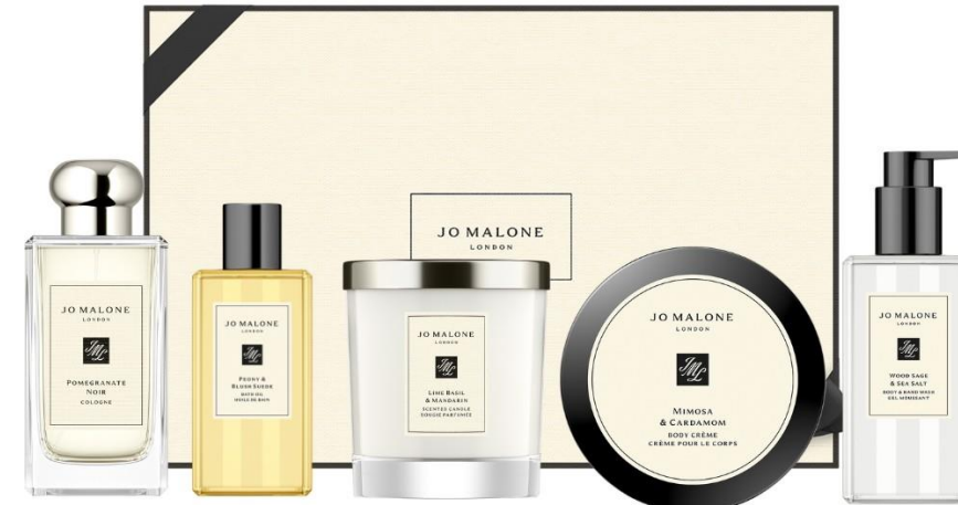
Pomegranate Noir Cologne 100ml, Peony & Blush Suede Bath Oil 250ml, Lime Basil & Mandarin Home Candle 200g, Mimosa & Cardamom Body Crème 175ml, Wood Sage & Sea Salt Body & Hand Wash 250ml SAR 2,030

لديكم الحرية المطلقة في اختيار الهدية المناسبة من بين أطقم الهدايا أو تشكيلتنا الكبيرة من المنتجات الفاخرة والتحف العطرية الأخرى غير العطور المبينة أعلاه. حانت ساعة المرح والتجربة: للحصول على المزيج العطري المثالي.