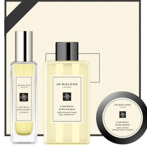
Lime Basil & Mandarin Collection Cologne 30ml, Body & Hand Wash 100ml, Body Crème 50ml SAR 665