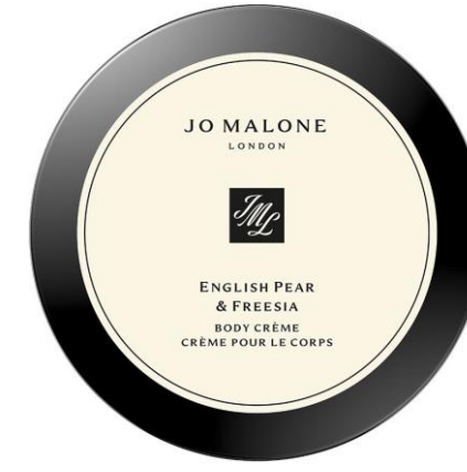
كريم الجسم 175ml SAR 455

Peony & Blush Suede English Pear & Freesia Mimosa & Cardamom Pomegranate Noir Wood Sage & Sea Salt Grapefruit Lime Basil & Mandarin Blackberry & Bay