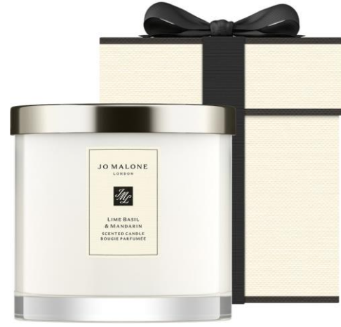
Lime Basil & Mandarin Deluxe Candle 600g SAR 920