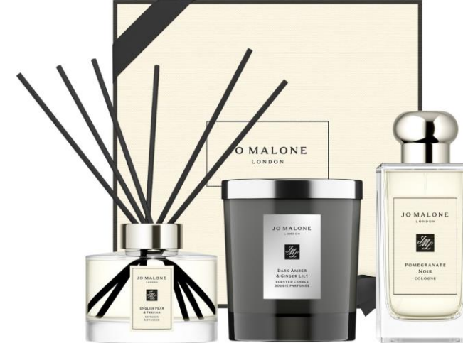
English Pear & Freesia Diffuser 165ml, Dark Amber & Ginger Lily Home Candle 200g, Lino nel Vento Linen Spray 175ml SAR 1,515