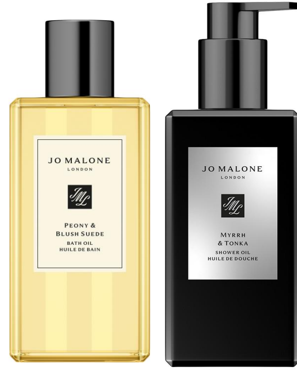
زيت الاستحمام والاسترخاء 250ml SAR 350

Lime Basil & Mandarin Pomegranate Noir English Pear & Freesia Blackberry & Bay Red Roses Peony & Blush Suede