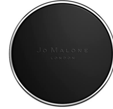
SCENT TO GO

Lime Basil & Mandarin Pomegranate Noir English Pear & Freesia Blackberry & Bay Peony & Blush Suede Red Roses