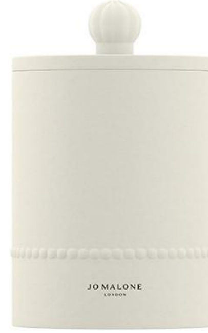
Lilac Lavendar & Lovage Candle SAR 595