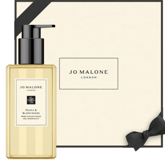
Peony & Blush Suede Body & Hand Wash 250ml SAR 235