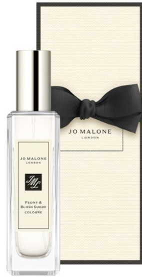
Peony & Blush Suede 30 ml Cologne SAR 330