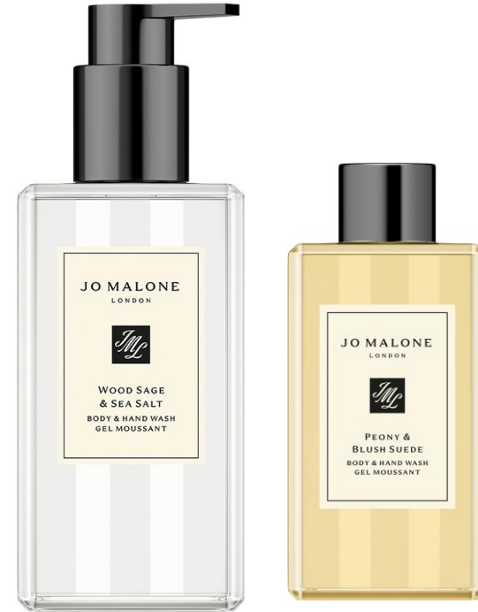
غسول الجسم واليدين 250ml SAR 235

English Pear & Freesia Peony & Blush Suede Lime Basil & Mandarin Pomegranate Noir Poppy & Barley Mimosa & Cardamom Red Roses Wood Sage & Sea Salt Orange Blossom