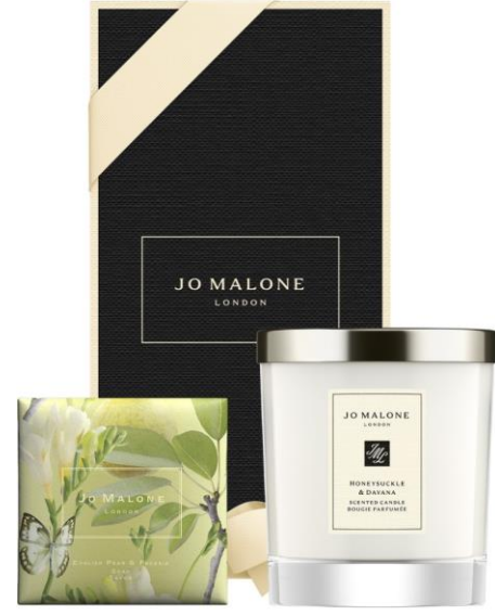
English Pear & Freesia Soap 100g Honeysuckle & Davana Home Candle 200g SAR 470