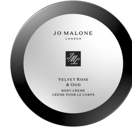
كريم الجسم بعبير الكولونيا المركزة

50ml SAR 195 Lime Basil & Mandarin Peony & Blush Suede English Pear & Freesia Pomegranate Noir Wood Sage & Sea Salt