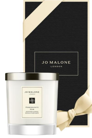
Pomegranate Noir Home Candle 200g SAR 470