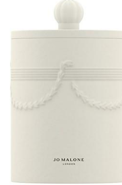
Pastel Macaroons Candle SAR 595