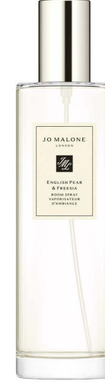
بخاخ الغرف SCENT SURROUND™ 100ml SAR 265

Lime Basil & Mandarin Pomegranate Noir English Pear & Freesia