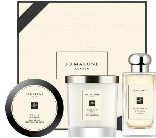
Orange Blossom Body Crème 175ml, Honeysuckle & Davana Cologne 100ml, Blackberry & Bay Home Candle 200g SAR 1,445