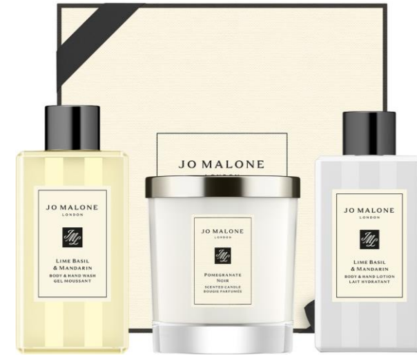
Lime Basil & Mandarin Body & Hand Wash 100ml Pomegranate Noir Home Candle 200g Lime Basil & Mandarin Body & Hand Lotion 100ml SAR 665

لديكم الحرية المطلقة في اختيار الهدية المناسبة من بين أطقم الهدايا أو تشكيلتنا الكبيرة من المنتجات الفاخرة والتحف العطرية الأخرى غير العطور المبينة أعلاه. حانت ساعة المرح والتجربة: للحصول على المزيج العطري المثالي.