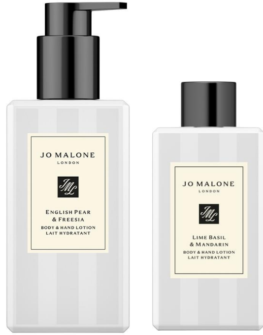
لوسيون الجسم واليدين 250ml SAR 325

تمتعوا بعشر دقائق من الراحة والاسترخاء أو ساعة. دللوا حواسكم بسيمفونية عطرية آسرة حيث ستتعلمون بالهدوء، والحيوية، والاسترخاء، والراحة. استخدموها معاً. جربوا خيارات مختلفة. استمتعوا بالتجربة.