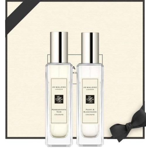
Pomegranate Noir Cologne 30ml, Peony Blush & Suede Cologne 30ml SAR 660