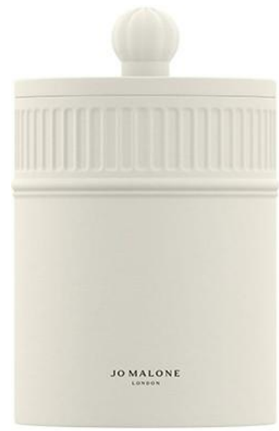
Fresh Fig & Cassis Candle SAR 595

عبير أخذ ينبعث من كل ركن في المنزل. زينوا منازلكم على الطريقة اللندنية مع شموع ومعطرات جو تعبق بأريج أسر.