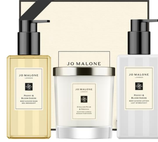
Peony & Blush Suede Body & Hand Wash 250ml, English Pear & Freesia Home Candle 200g Peony & Blush Suede Body & Hand Lotion 250ml SAR 890