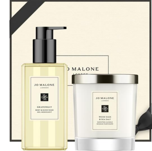
Grapefruit Body & Hand Wash 250ml Wood Sage & Sea Salt Home Candle 200g SAR565