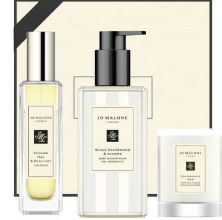
English Oak & Hazelnut Cologne 30ml, Wood Sage & Sea Salt Body & Hand Wash 250ml, Pomegranate Noir Travel Candle 60g SAR 730

لديكم الحرية المطلقة في اختيار الهدية المناسبة من بين أطقم الهدايا أو تشكيلتنا الكبيرة من المنتجات الفاخرة والتحف العطرية الأخرى غير العطور المبينة أعلاه. حانت ساعة المرح والتجربة: للحصول على المزيج العطري المثالي.