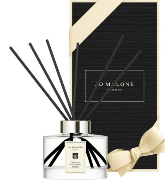
Lime Basil & Mandarin Diffuser 165ml SAR 445