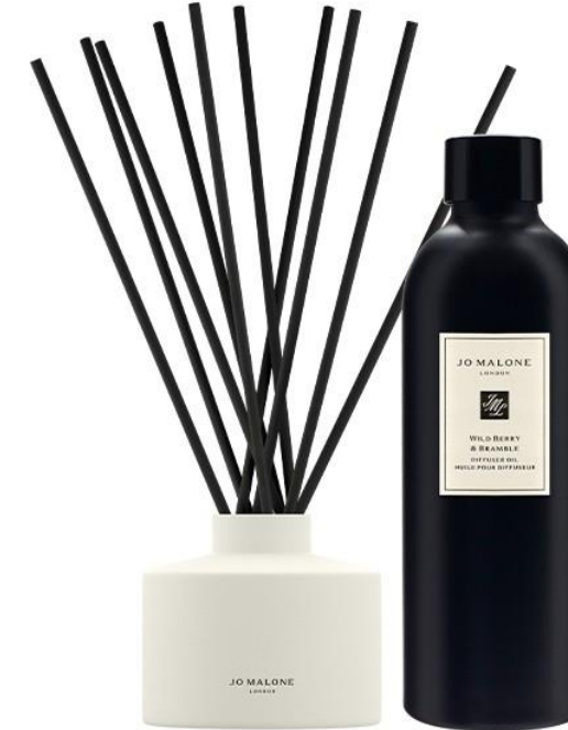
Wild Berry Bramble Townhouse Diffuser SAR 890