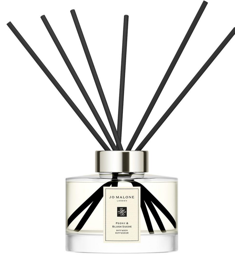
موتع الرائحة العطرية SCENT SURROUND™ 165ml SAR 445

Peony & Blush Suede Lime Basil & Mandarin, Pomegranate Noir English Pear & Freesia Red Roses