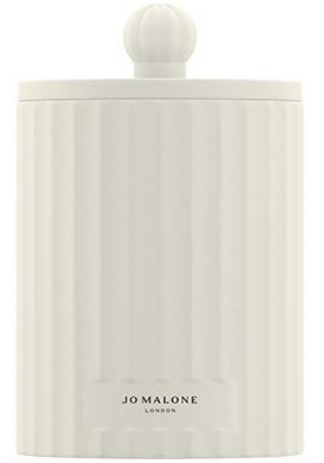
Wild Berry Bramble Candle SAR 595