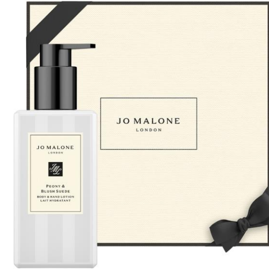
Peony & Blush Suede Body & Hand Lotion 250ml SAR 325

لديكم الحرية المطلقة في اختيار الهدية المناسبة من بين أطقم الهدايا أو تشكيلتنا الكبيرة من المنتجات الفاخرة والتحف العطرية الأخرى غير العطور المبينة أعلاه. حانت ساعة المرح والتجربة: للحصول على المزيج العطري المثالي.