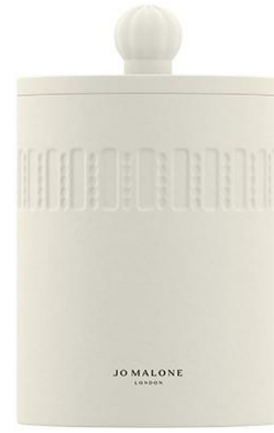
Green Tomato Vine Candle SAR 595