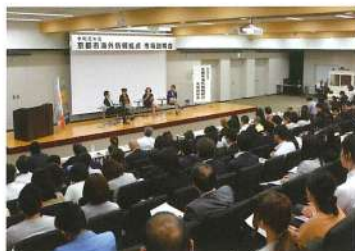
海外情報拠点説明会