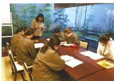
外国語研修（出張型）