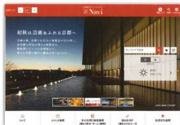
京都観光 Navi（日本語サイト）