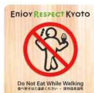
マナー啓発ステッカー