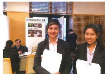
留学生就職面談会