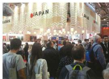
海外での旅行商談会