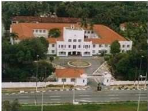
Escola de Aprendizes-Marinheiros de Pernambuco