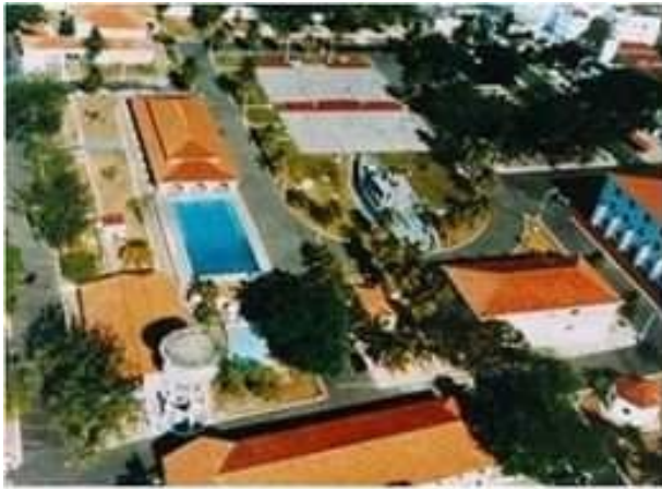
Escola de Aprendizes-Marinheiros do Ceará