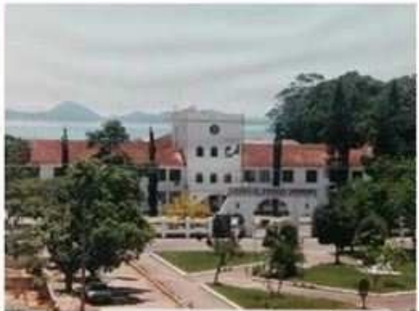
Escola de Aprendizes-Marinheiros de Santa Catarina