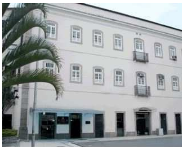
Serviço de Seleção do Pessoal da Marinha (SSPM)

Serviço de Seleção do Pessoal da Marinha (SSPM) - Responsável pelo planejamento, execução e coordenação das atividades de recrutamento necessárias à captação de pessoas para o ingresso voluntário na MB, à exceção dos Concursos do Corpo de Fuzileiros Navais (CFN); e responsável por exercer as atividades de sua competência na execução dos concursos públicos para ingresso na MB, dos concursos internos e exames para acesso na carreira, além dos processos seletivos determinados pela Administração Naval. Também é responsável pelo planejamento e execução das avaliações psicológicas necessárias para selecionar candidatos para ingresso nas carreiras da MB.