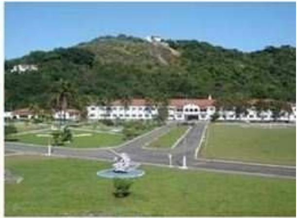
Escola de Aprendizes-Marinheiros do Espírito Santo