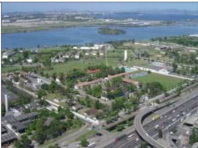
Centro de Instrução Almirante Alexandrino

Centro de Instrução Almirante Alexandrino (CIAA) - Responsável por ministrar cursos de Especialização e Aperfeiçoamento de Praças, Habilitação de Sargentos e Suboficiais, e Qualificação Técnica Especial. Também conduz Cursos Especiais e Exeditos para Praças. Ministra, também, o Curso de Formação de Cabos do Corpo Auxiliar de Praças (CAP), para candidatas do Ensino Técnico de Nível Médio que ingressaram por meio de um concurso específico, visando a formação militar-naval do aluno possuidor de formação profissional técnica, capacitando-o para o exercício de suas funções no Serviço Ativo da Marinha.