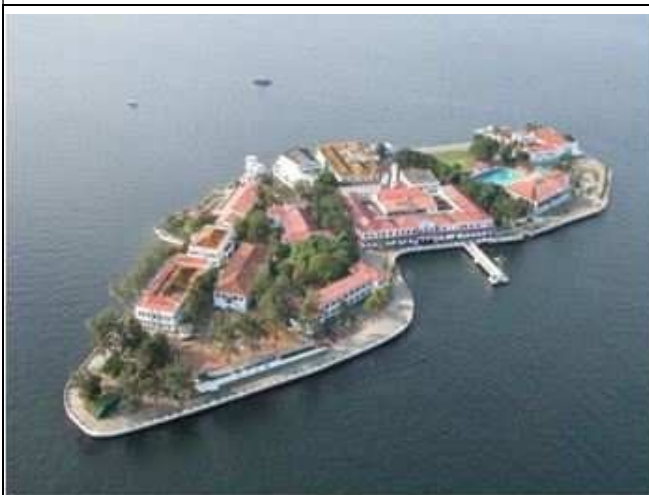
Centro de Instrução Almirante Wandenkolk

Centro de Instrução Almirante Wandenkolk (CIAW) - Responsável pela condução do Curso de Formação de Oficiais, oriundos do meio civil, para o Corpo de Saúde, Corpo de Engenheiros Navais, Quadro Complementar, Quadro Técnico e Quadro de Capelães Navais, selecionados por meio de concurso público. O CIAW é responsável, também, pelos Cursos de Especialização e Aperfeiçoamento de Oficiais, em nível de pós-graduação, e pelos Cursos Especiais e Expeditos destinados a preparar Oficiais para o exercício de funções específicas técnico-profissionais, conforme as necessidades da Marinha.