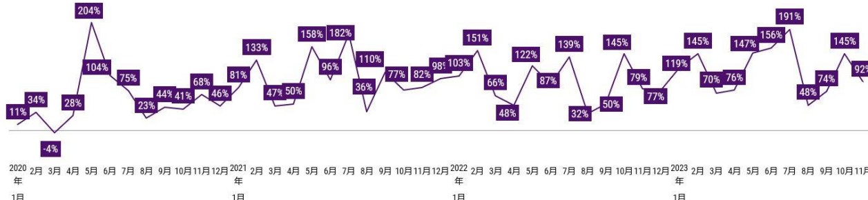
<図表3> 外食業態（レストラン）の出前（デリバリー）売上-2019年同月比

*小売店、弁当・惣菜店、自動販売機、学食・社食を除く レストラン業態（宅配ピザ含む）における宅配