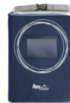
レブメイトキット