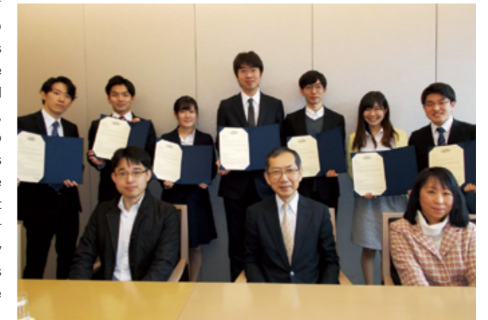
写真：修了式出席者のみ掲載

Those students who successfully complete two semesters of the GPP, by accruing 8 credits from 4 different classes in addition to participating in two workshops worth 8 credits, will receive a certificate of completion from the President of Keio University and the Dean of the Faculty of Business and Commerce. Since it is possible to complete the program during the 3rd year of a student's college career, the certification will likely help in the job hunting process. Additionally, since students will be recognized as a participant in an Honors Program, they will surely be at an advantage when applying to either a domestic or international graduate studies program. Furthermore, students can begin the program not only in the Spring of their 3rd year, but also in the Fall of their 3rd year or Spring of their 4th year, thus allowing many to have the opportunity to receive certification in the program. Finally, it is worth noting that students do not have to enroll in the program over consecutive semesters.