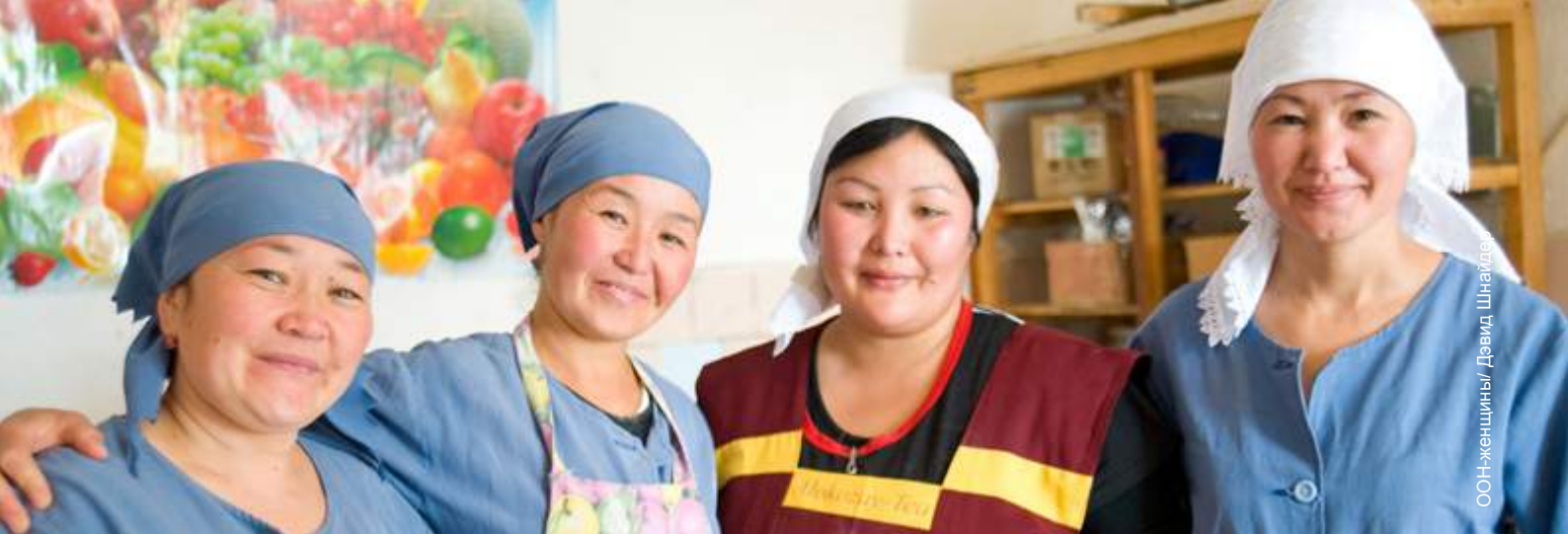
ООН-женщины / Дэвид Шнайдер